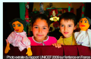
Photo extraite du rapport UNICEF 2009 sur l'enfance en France

Dans 54 articles et deux protocoles facultatifs, la Convention énonce les droits fondamentaux qui sont ceux de tous les enfants du monde :